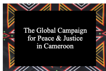
Canadians for Peace in Cameroon